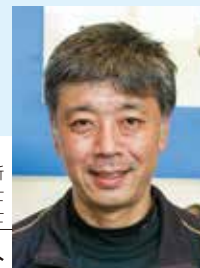
社会・生活環境研究所 作業療法士 二級建築士