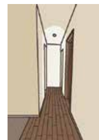
図1) コントラストの付いた廊下

このことから、高齢者への環境支援は、高齢者の見ている世界を踏まえた上で、明るくなるよう照度・色温度を踏まえた支援計画を立てる必要があります。更に、支援計画においては、照明だけではなく、コントラストを受けるような色彩の配慮がもとめられることを頭においておきたいものです(図1)。