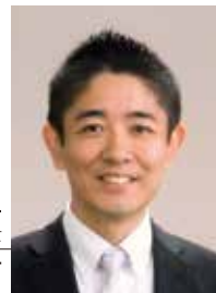
Sport(エスポート) リハビリテーション福祉コンダクター 理学療法士

自分の体力を認識できていないことも問題ですが、それ以上に自分の筋や関節に正しく指令を伝えられないことが問題です。段差につまずくことが増えたり、よけたつもりが物にぶつかったりする人は黄色信号です。全身に神経を張り巡らせ手足の先まで自分の思い通りに動かせるよう活動量を増やしましょう。