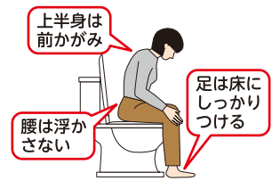
(図1) 女性の排尿の際のベストポジション

女性の場合の排尿をする際のベストポジションがあるのをご存知ですか？足の裏を床にきちんと付けて座り、上半身は少し前かがみに。そして腰は浮かさない。