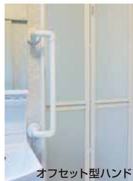
オフセット型ハンド